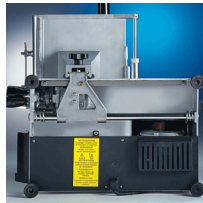
Underside motor protection plate