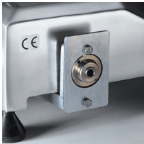
Device for releasing the carriage