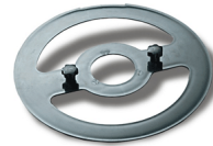
Blade removal tool