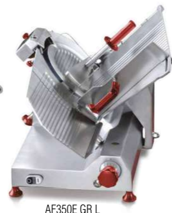
AF350E GR L