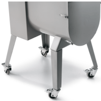
Optional legs with wheels