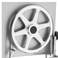
Hermetic upper pulley