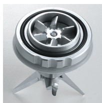
Aluminium gears - standard