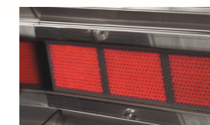
Quemador gas Brûleur à gaz Gas burner