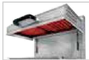
Résistances blindées / Metal heating elements