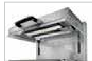
Gaz forte puissance / High power gas