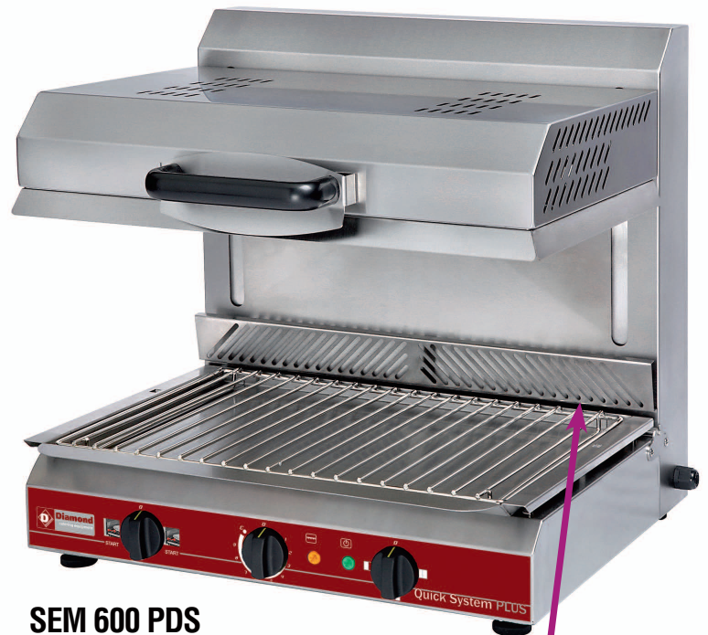
SEM 600 PDS

PDS (PLATE DETECTION SYSTEM) Mise en chauffe instantanée par contact Instant heatup through bar contact