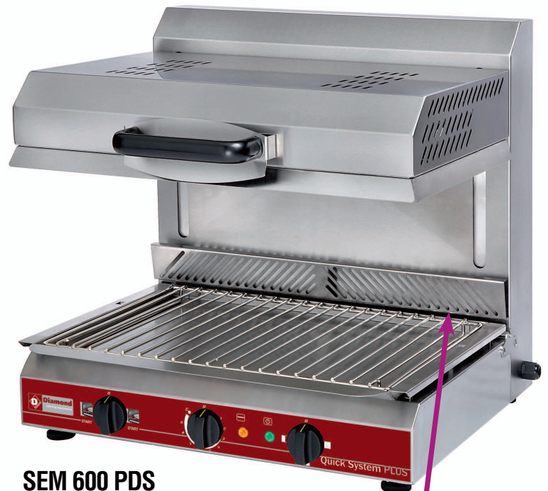
SEM 600 PDS

PDS (PLATE DETECTION SYSTEM) Mise en chauffe instantanée par contact Instant heatup through bar contact