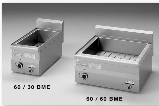
60 / 30 BME