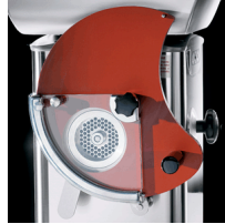
Optional patty former