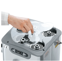
Compartment for knives and plates

Innovant hachoir réfrigéré super compact. - Système de refroidissement exclusif avec module thermoélectrique: Sans compresseur. Sans gaz. Economie d'énergie. - Puissance module thermoélectrique: 70 Watt - Refroidissement sur col et bouche. - Température auto-thermostatée. - Thermomètre digital de contrôle. - Trémie et col inox amovibles pour nettoyage. - Caractéristiques TC comme modèle Barcellona. - N'importe quelle manutention, n'a pas besoin de frigoriste pour SAV.