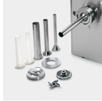
Optional stuffer kit